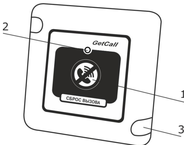
Рисунок 1. Внешний вид кнопки сброса вызова GC-0421W1

На рис.1 приведен внешний вид кнопки сброса вызова.