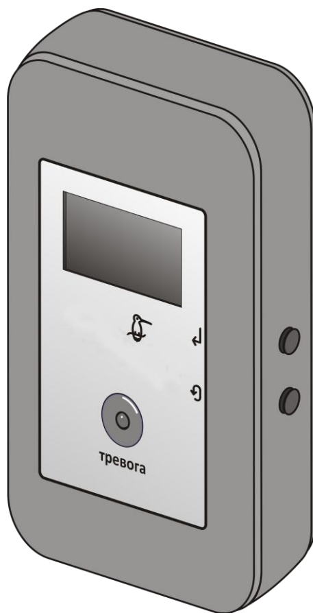
Мобильная тревожная кнопка «Гаруда»

Дополнительные сведения об изделии Вы можете получить на сайте www.telemak.ru .